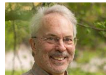
Henning Melber.

On parle encore aujourd'hui de sa foi dans la nécessaire indépendance de la fonction publique internationale au service d'une bonne gouvernance mondiale. Et de son courage personnel, de sa croyance dans la bonté de l'âme humaine, de son attachement aux inspirations spirituelles émanant des différentes religions et philosophies.